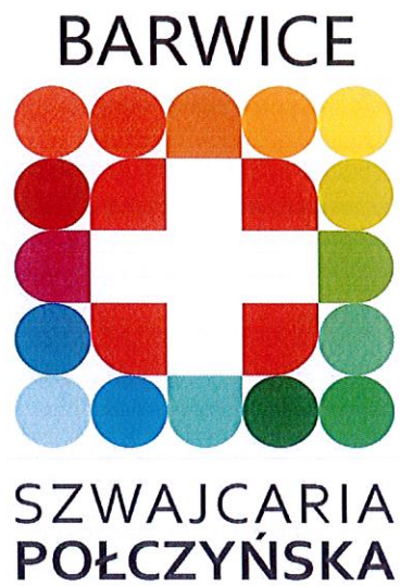
Logo w wersji kolorowej